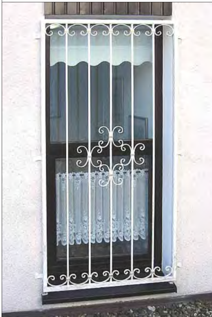
93 01 79 | 93 91 15 | 93 89 96 C-Bogen, klein | C-Bogen, groß | Vierkanteisen 12 x 12 mm