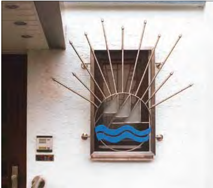
83 06 54 | 83 02 95 Relingstange V2A, Ø 12 mm | Relingstangabschluss V2A

Die auf den Fotos verwendeten Produkte sind Beispielprodukte. Unterschiede in Form, Material und Maßen zu den in unserem Produktkatalog abgebildeten Produkten möglich. Alle verwendeten Fotos wurden von bima-Kunden zur Verfügung gestellt. Abgebildete Produkte sind teilweise keine Lagerartikel, Lieferzeiten bitte erfragen.