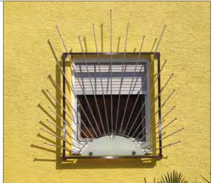
83 06 54 | 83 06 87 Relingstange V2A, Ø 12 mm | Kugel V2A, Ø 20 mm