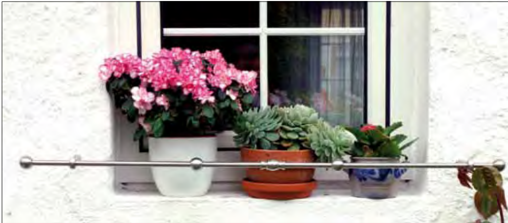
83 03 78 Einschraubstück V2A