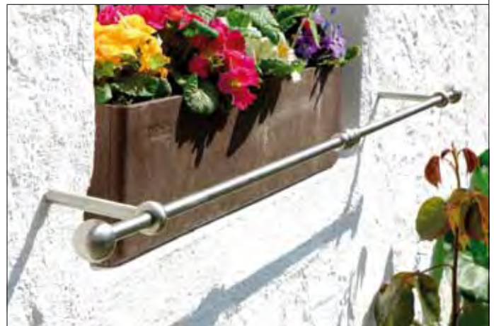
83 09 20 Relinghalter V2A