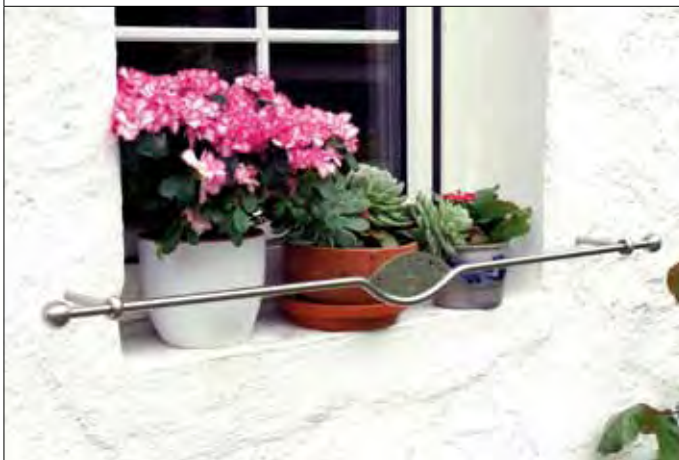
83 01 07 Designstab V2A