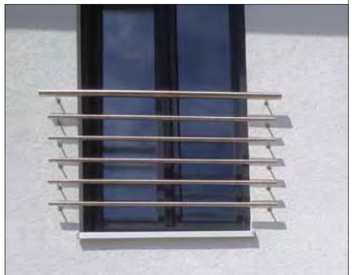
83 06 51, Rohr V2A, \varnothing 42,4 x 2,0 mm