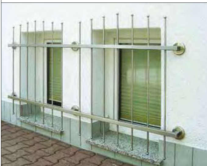
83 05 98, Rohr V2A, 40 x 40 x 2 mm